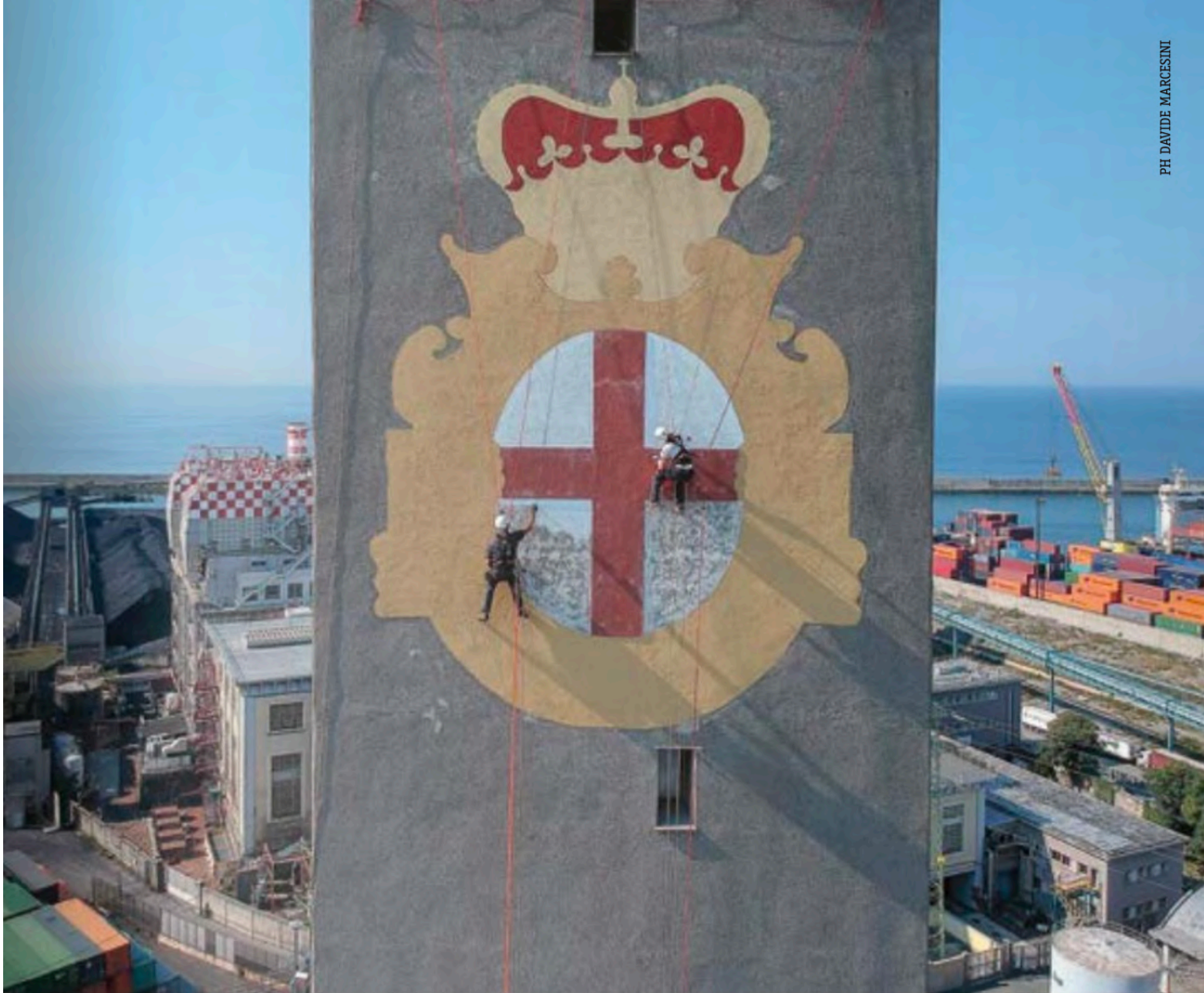
INTERVENTO DI VALORIZZAZIONE E RESTAURO DELLO STEMMMA DELLA LANTERNA - GENOVA

L'immagine della croce di San Giorgio sulla Lanterna, simbolo di Genova, che giorno dopo giorno quasi per una magia, riprendeva colore senza che i cittadini vedessero il cantiere, è uno degli esempi recenti ma ovviamente non l'unico, del restauro in quota di cui la ditta Formento di Finale Ligure è uno dei leader italiani.