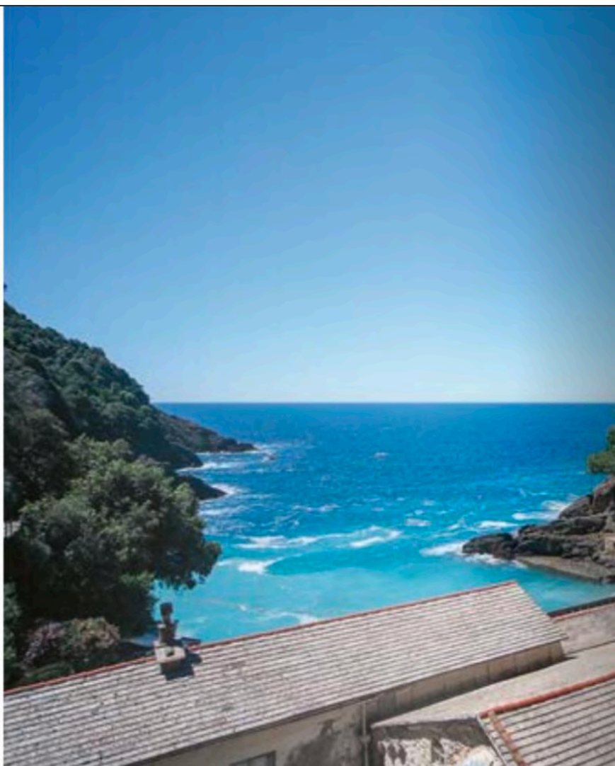
MANUTENZIONE TORRE NOLARE DELL'ABBAZIA DI SAN FRUTTUOSO - CAMOGLI (GE)

monumento più importante. Per noi il restauro non è il semplice recupero di un'opera ma è restituire a una comunità, anche in contesti più isolati come quelli che caratterizzano il territorio ligure, la sua cultura quasi sempre secolare che quel monumento rappresenta per tramandarlo alle generazioni future".